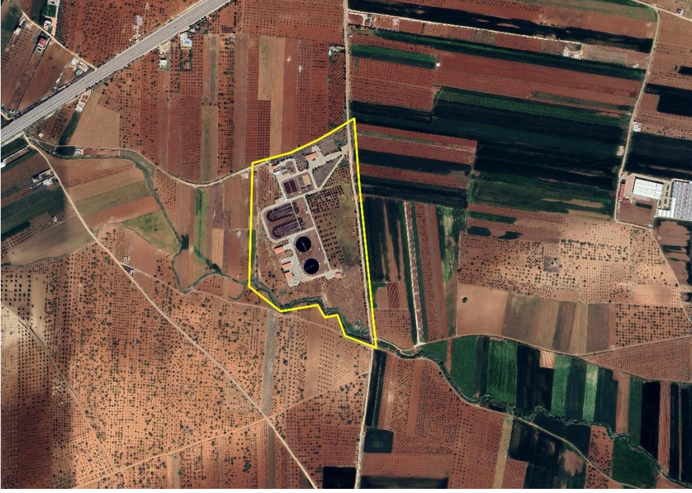
 ekil 1: Planlama Alanı Konumu

Planlama alanı; Gaziantep İli, Oğuzeli İlçesi, K rk n Mahallesi sınırları i erisinde yer almaktadır.