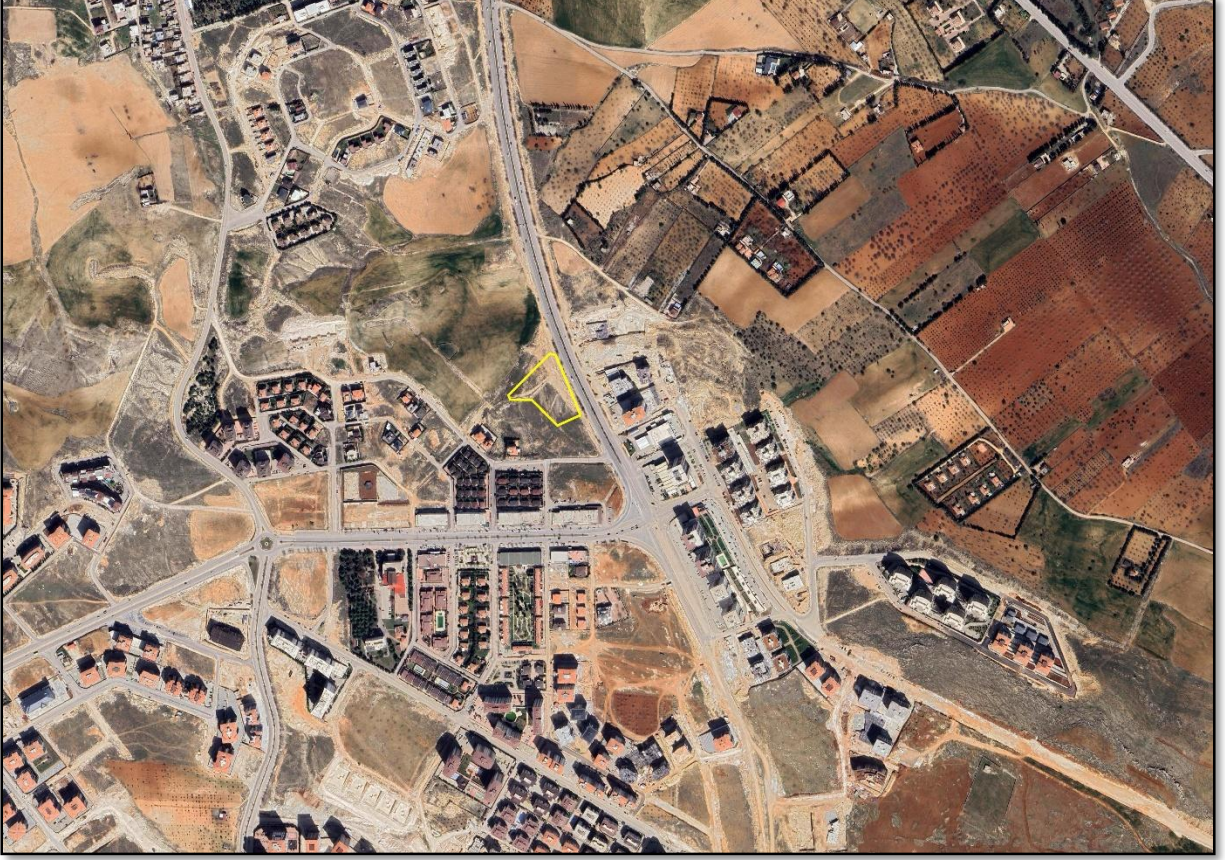
řekil 1: Planlama Alanı Konumu

Uygulama imar planı deęiřiklięine konu alan, řahinbey İlçesi, Kızılhisar mahallesi sınırları ierisinde yer almaktadır.