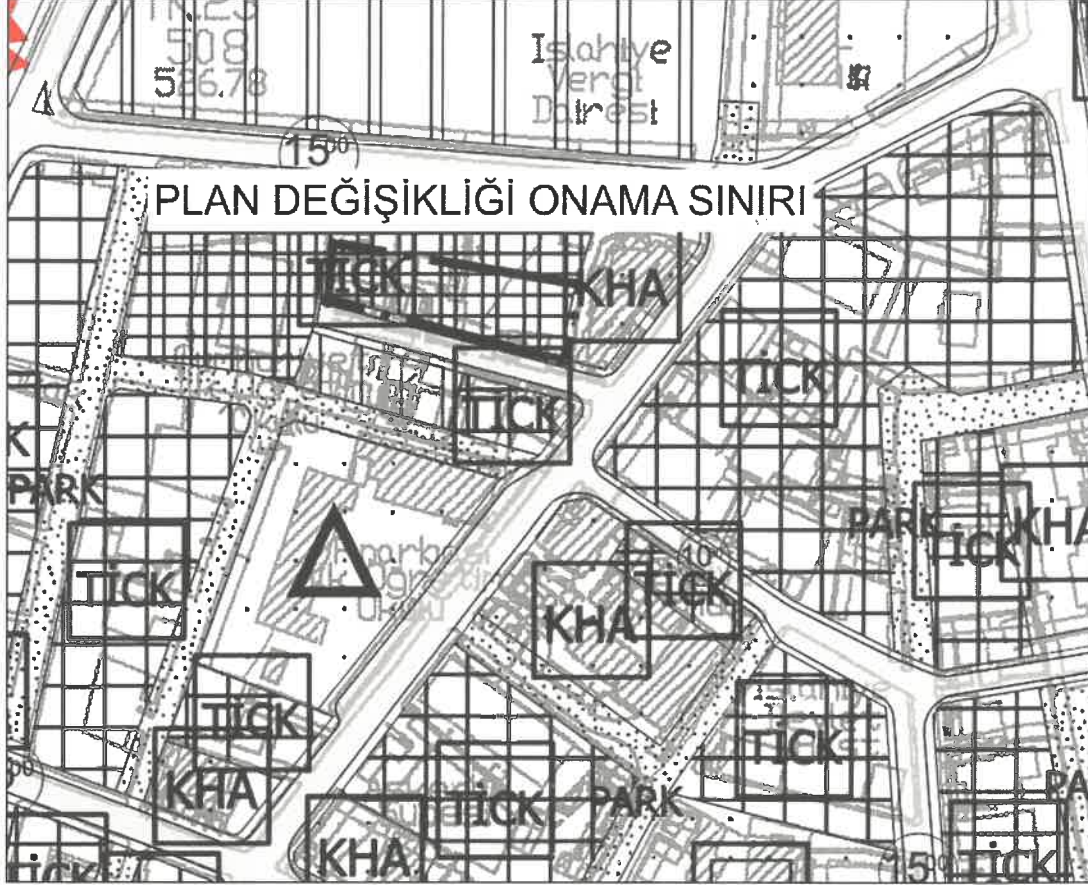
Planlama Alanına Ait 1/5000 Ölçekli Öneri Nazım İmar Planı Değişikliği

Bölgenin hem konut ihtiyacını karşılayacak hem de ticari faaliyetlerin sürdürülebilir biçimde artmasına olanak sağlayacak şekilde Ticaret + Konut (B5) kullanım fonksiyonu öngörölmüş ve bu fonksiyon ile bölgedeki dengeli kentsel gelişim hedeflenmiş olup bu kapsamda plan değişikliği hazırlanmıştır.