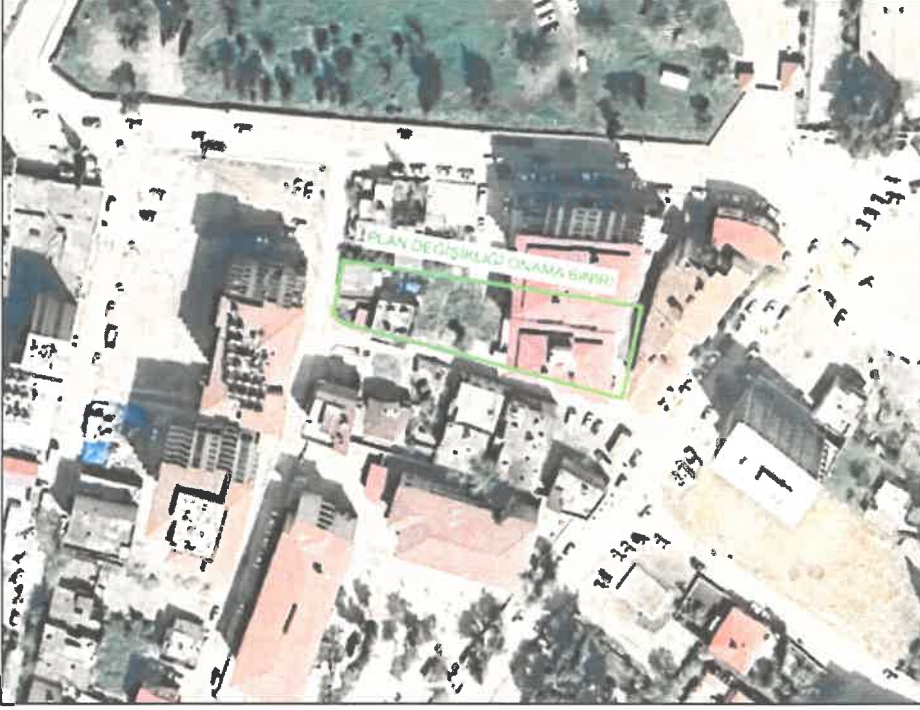
Planlama Alanına Ait Uydu Görüntüsü

İmar Plan Değişikliği yapılan alan, Gaziantep ili İslahiye İlçesi Çamlık Mahallesi Askeri Alan bölgesinin güneyinde konumlanmaktadır.