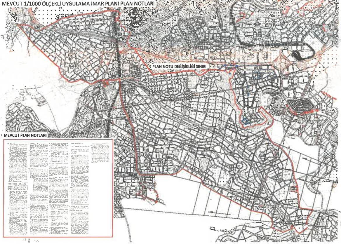
Şekil 2: Mevcut 1/1000 Ölçekli Uygulama İmar Planı Plan Notları