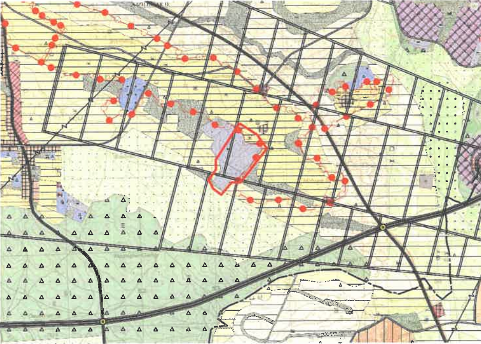
Şekil 2: Planlama Alanı Mevcut 1/25.000 Ölçekli Nazım İmar Planı

Plan değişikliğine konu alan mevcut 1/25.000 ölçekli nazım imar planında Orta Yoğunluklu Gelişme Konut Alanı, Belediye Hizmet Alanı, İbadet Alanı ve Park ve Yeşil Alan, 1/5000 ölçekli nazım imar planında Belediye Hizmet Alanı (BBHA), İbadet Alanı, Park Alanı ve İmar Yolu olarak görülmektedir.