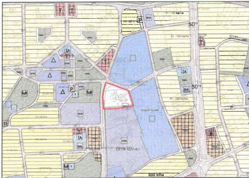
Şekil 3: Mevcut 1/5000 Ölçekli Nazım İmar Planı

Planlama alanı yürürlükteki 1/5.000 ölçekli nazım imar planında plansız alan kullanımında kalmaktadır.