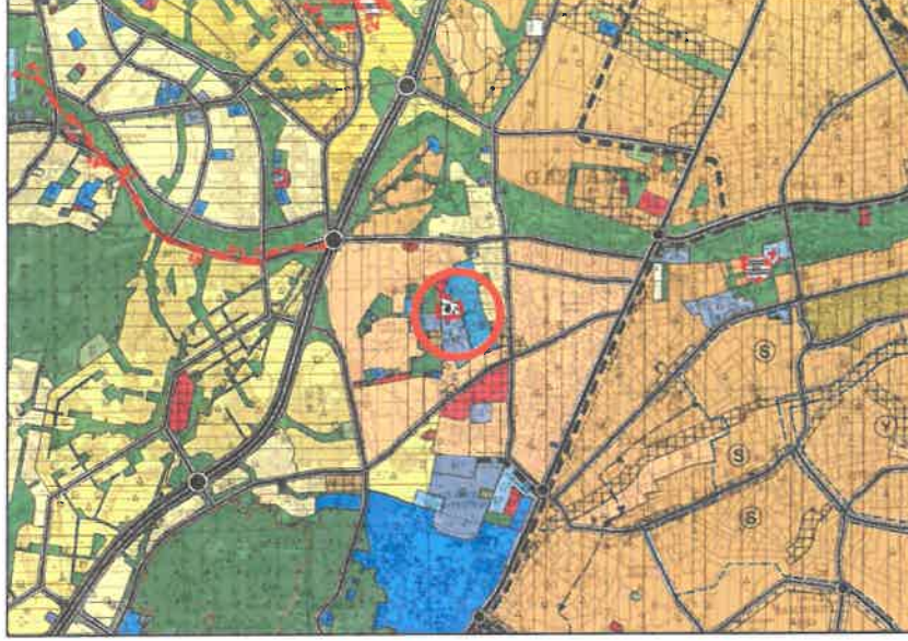
Şekil 2: Mevcut 1/25000 Ölçekli Nazım İmar Planı

Planlama alanı yürürlükteki 1/25.000 ölçekli nazım imar planında plansız alan kullanımında kalmaktadır.