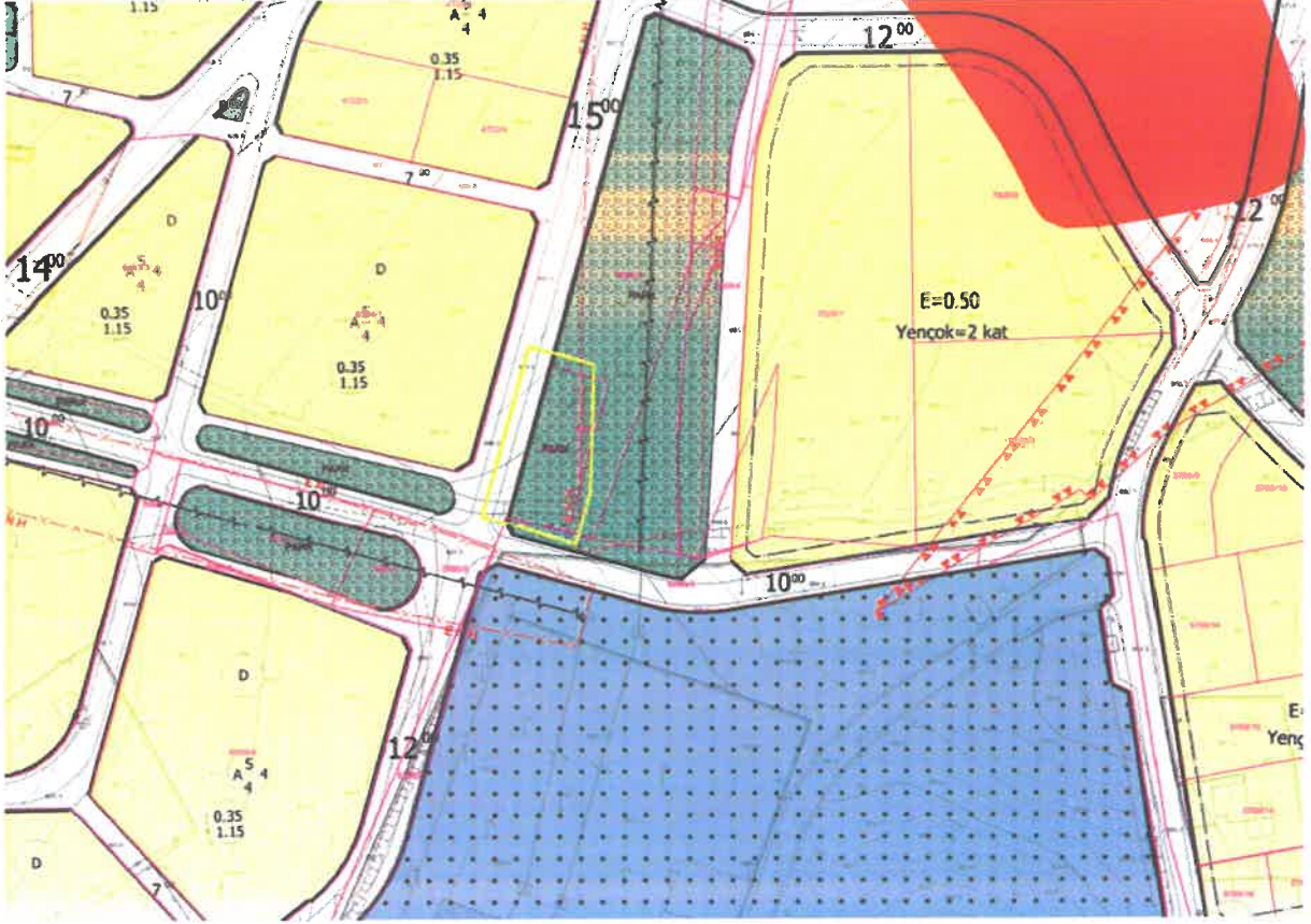
Şekil 2: Yürürlükteki 1/1000 Ölçekli uygulama İmar Planı

Planlama alanı yürürlükteki 1/1000 ölçekli uygulama imar planında park alanı olarak görülmektedir.