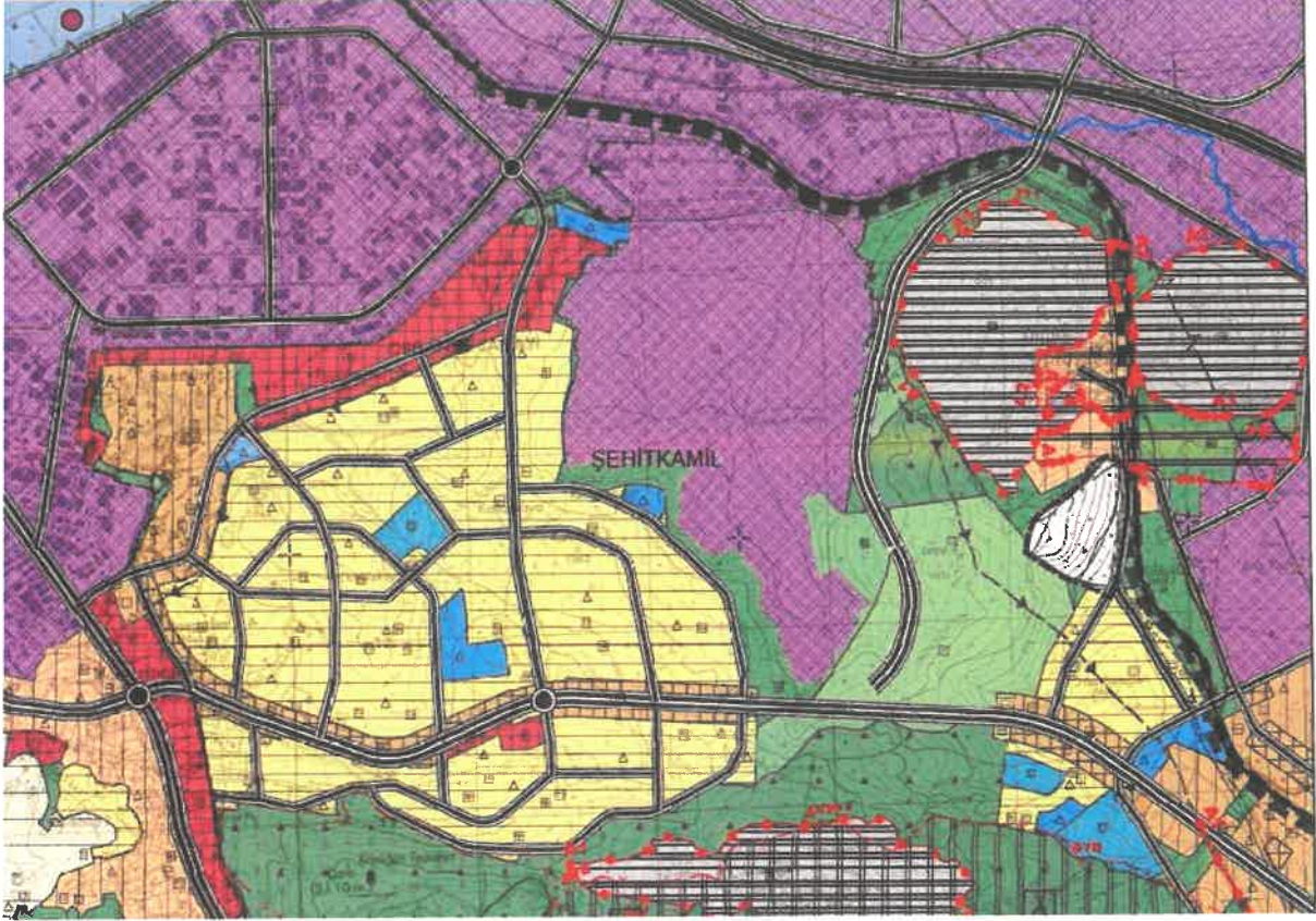
Şekil 2: Yürürlükteki 1/25000 Ölçekli Nazım İmar Planı

Planlamaya konu alan yürürlükteki 1/25.000 ölçekli nazım imar planında plansız alan olarak görülmektedir.