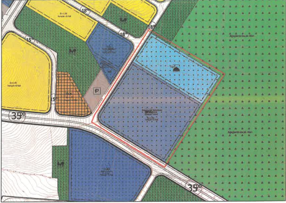
Şekil 2: Mevcut 1/1000 Ölçekli uygulama İmar Planı

Planlama alanı yürürlükteki 1/1000 ölçekli uygulama imar planında cami ve büyükşehir belediyesi hizmet alanı kullanımında kalmaktadır.