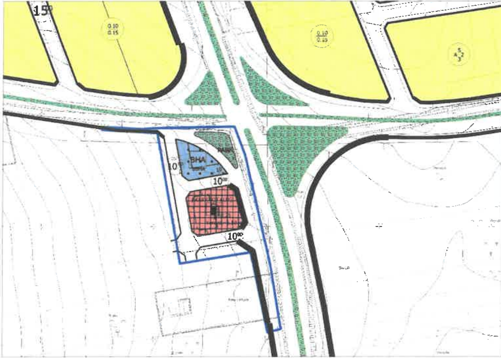
Şekil 2: Planlama Alanı Mevcut 1/1000 Ölçekli Uygulama İmar Planı

Plan değişikliğine konu alan mevcut 1/1000 ölçekli uygulama imar planında büyükşehir belediye hizmet alanı, akaryakıt+lpq satış ve servis istasyonu alanı, park alanı ve imar yolu olarak görülmektedir.