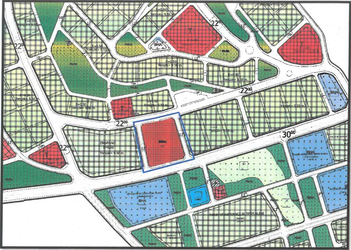
Şekil 2: Planlama Alanı Mevcut 1/1000 Ölçekli Uygulama İmar Planı