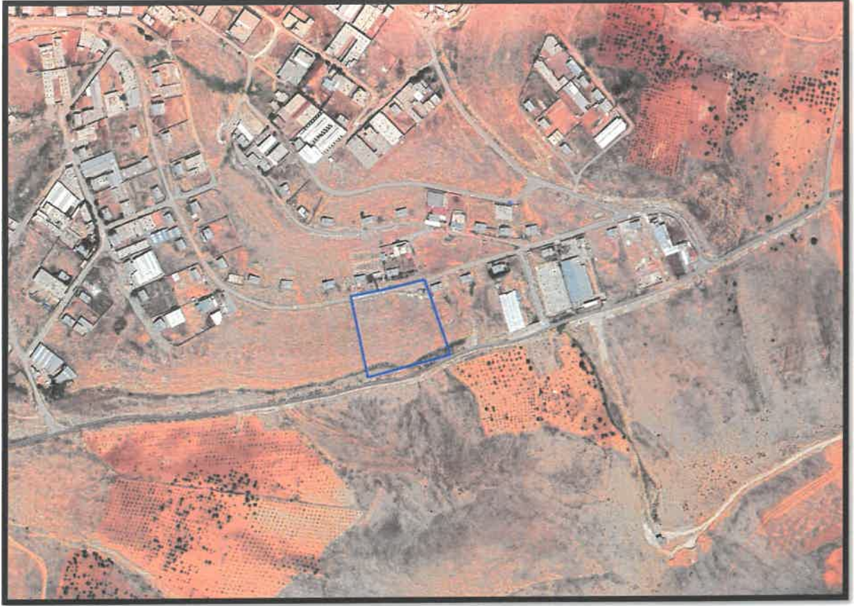
řekil 1: Planlama Alanı Konumu

Uygulama imar planı deęiřiklięine konu alan, Oęuzeli İlęesi, aybařı mahallesi Besi Organize Sanayi Blgesi sınırları ierisinde yer almaktadır.